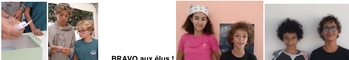
BRAVO aux élus !