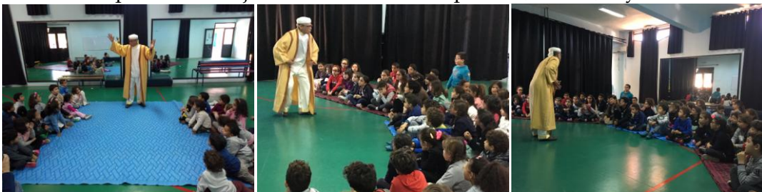
Plaisir d'écouter les contes traditionnels