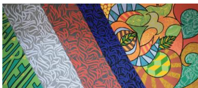
Groupe Scolaire Jacques Majorelle