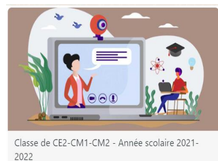
Classe de CE2-CM1-CM2 - Année scolaire 2021-2022